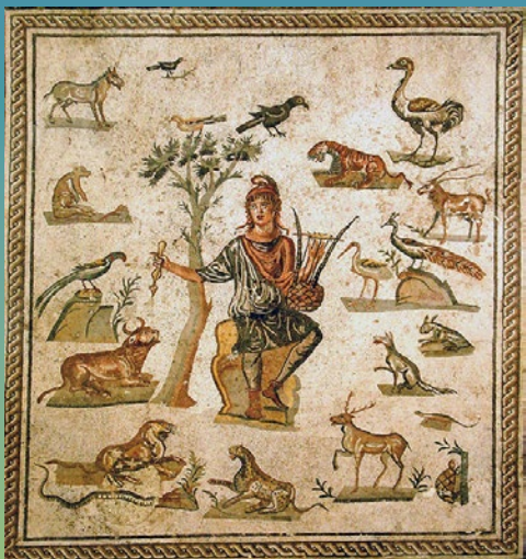
foto di Giovanni dall'Orto che riproduce Orfeo circondato dagli animali. Mosaico pavimentale romano, da Palermo. Museo archeologico regionale di Palermo.